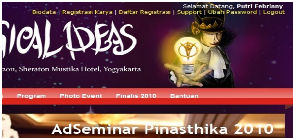
Gambar 5.2 Menu Peserta