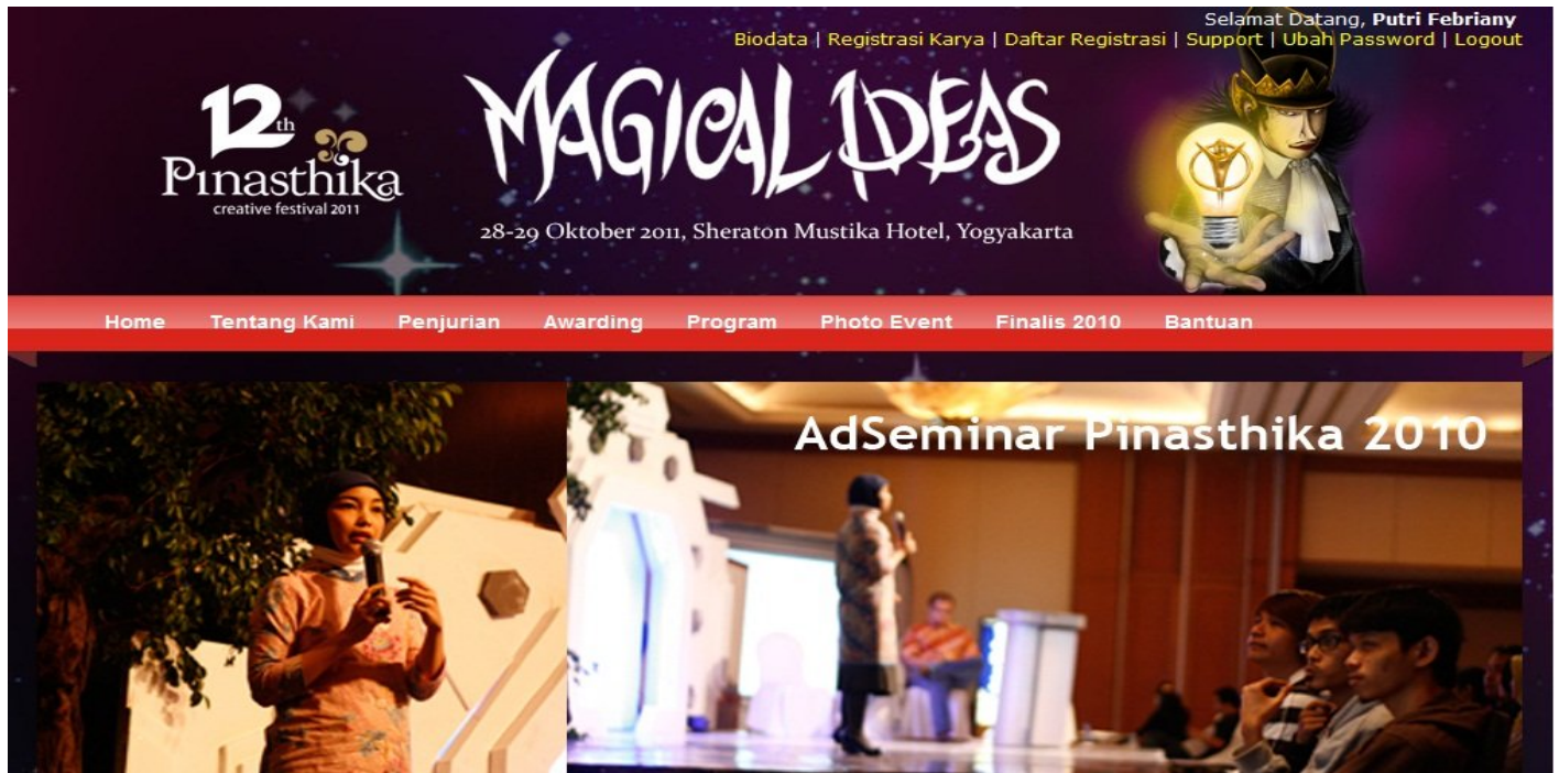
Gambar 5.1 Halaman awal pemilik akun Pinasthika