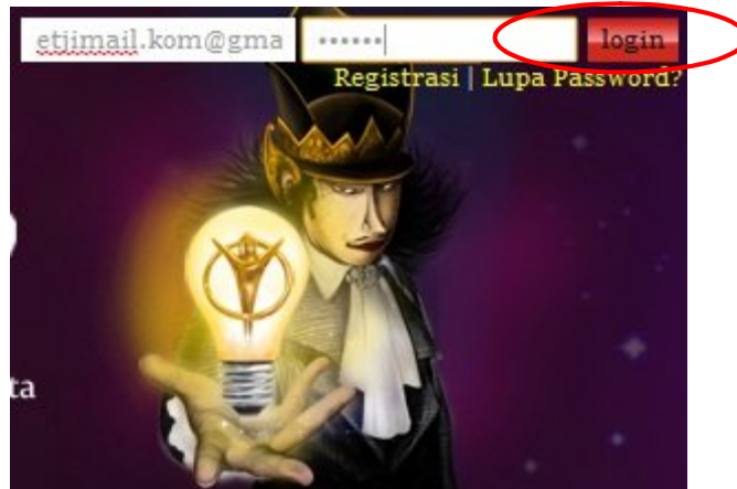
Gambar 1.4 Form Login