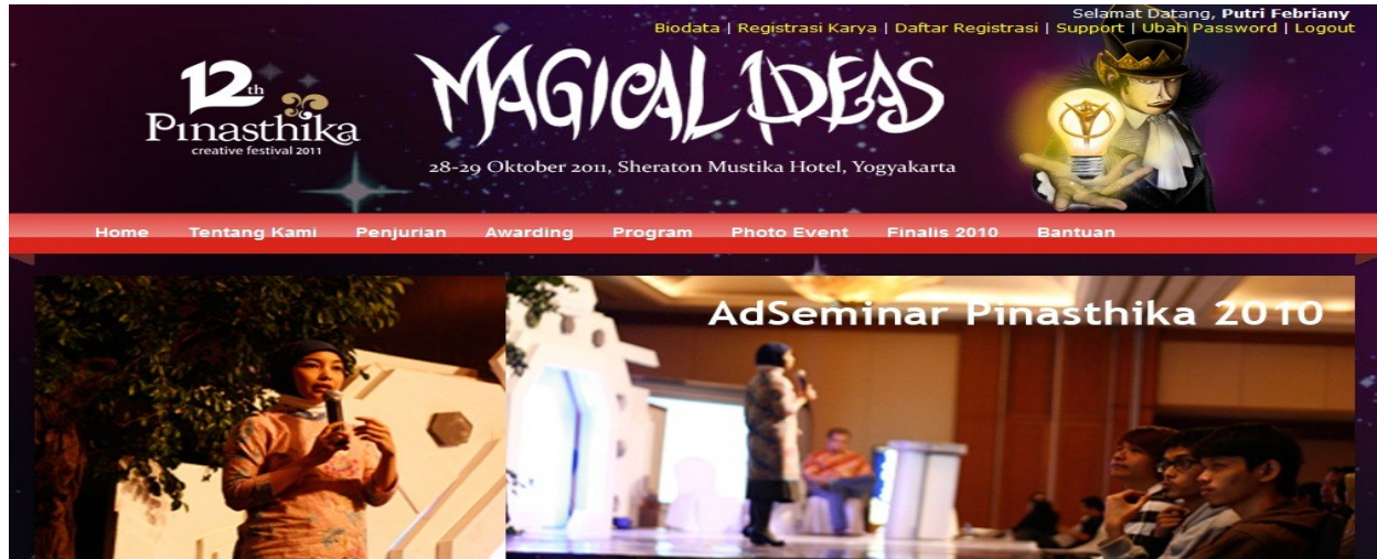
Gambar 8.1 Menu Peserta